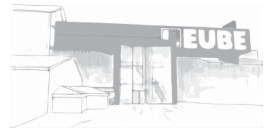
BV Zementwerk Gartenbau