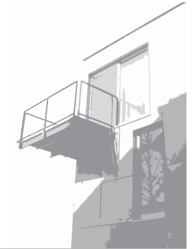
EFH Brandner Wieland